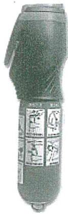
図2 『消棒 RESCUE®』 (株式会社ワイピーシステム ウェブサイトより)