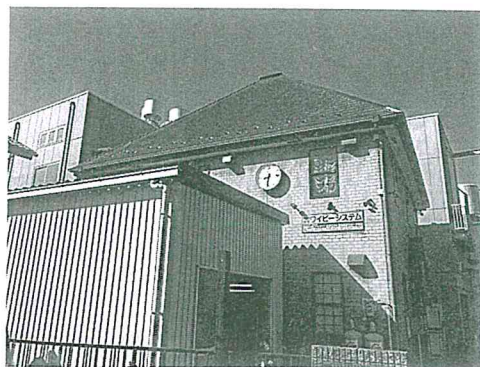
株式会社ワイピーシステム